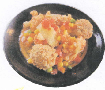
肉団子と カリフラワーのトマト煮