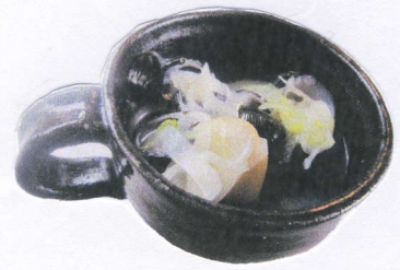
しじみと長いもの スープ